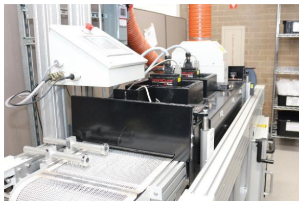
Abbildung 4. Laborförderband für Tests

Insgesamt wurden 48 Durchläufe durchgeführt und die Daten zusammengestellt. Die Tests wurden in unserem Labor auf einem Förderband durchgeführt. Das Förderband verfügt über einen präzisen Geschwindigkeitsregler, und die Geräte werden von einer Metallplatte unter dem Band gestützt. Das verwendete Förderband und die Befestigungen/Ausrichtungsführungen sind in den Abbildungen 4 und 5 dargestellt.